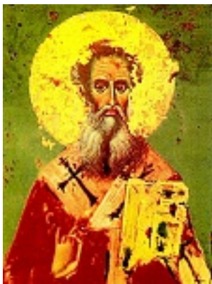
Άγιος Παρθένιος επίσκοπος Ραδοβυσδίου