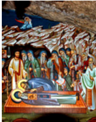
Η κοίμηση του Οσίου Διονυσίου του Ρήτορος