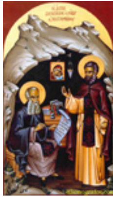
Όσιοι Διονύσιος «ο ρήτωρ» και ο υποτακτικός του Άγιος Μητροφάνης ο πνευματικός