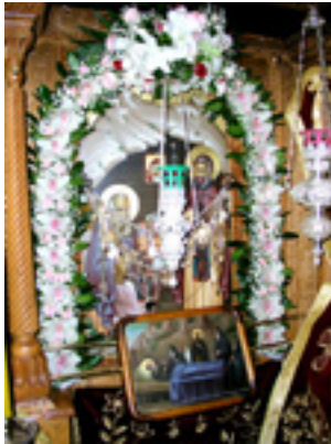
Όσιοι Διονύσιος «ο ρήτωρ» και ο υποτακτικός του Άγιος Μητροφάνης ο πνευματικός