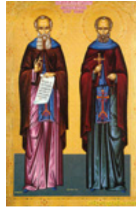
Όσιοι Διονύσιος «ο ρήτωρ» και ο υποτακτικός του Άγιος Μητροφάνης ο πνευματικός