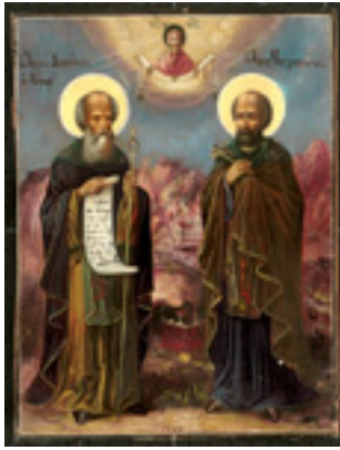
Όσιοι Διονύσιος «ο ρήτωρ» και ο υποτακτικός του Άγιος Μητροφάνης ο πνευματικός