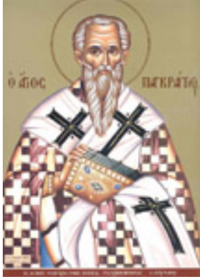
Άγιος Παγκράτιος<br />Ιερομάρτυρας<br />επίσκοπος Ταυρομενίας