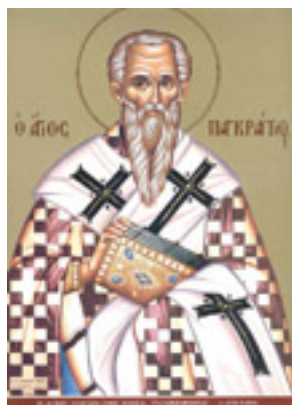
Άγιος Παγκράτιος<br />Ιερομάρτυρας<br />επίσκοπος Ταυρομενίας