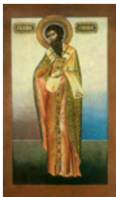
Όσιος Γεώργιος<br />επίσκοπος Μυτιλήνης