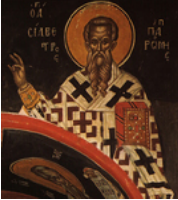
Άγιος Σίλβεστρος Πάπας Ρώμης