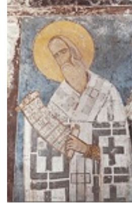
Άγιος Μιχαήλ ο Χωνιάτης Μητροπολίτης Αθηνών