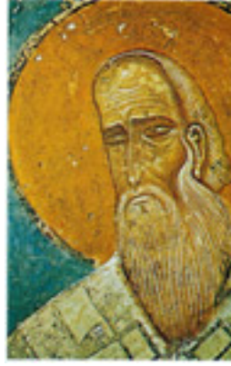
Άγιος Μιχαήλ ο Χωνιάτης Μητροπολίτης Αθηνών