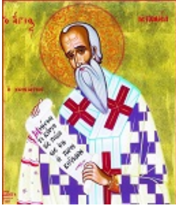
Άγιος Μιχαήλ ο Χωνιάτης Μητροπολίτης Αθηνών