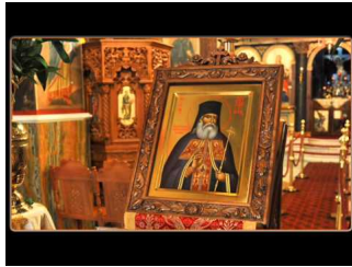
Ο Παρακλητικός Κανών του Αγίου Λουκά του Ιατρού