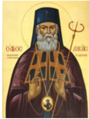
Άγιος Λουκάς Αρχιεπίσκοπος Συμφερουπόλεως και Κριμαίας