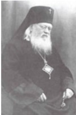
Άγιος Λουκάς Αρχιεπίσκοπος Συμφερουπόλεως και Κριμαίας