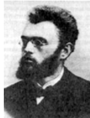
Άγιος Λουκάς Αρχιεπίσκοπος Συμφερουπόλεως και Κριμαίας