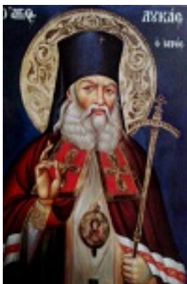
Άγιος Λουκάς Αρχιεπίσκοπος Συμφερουπόλεως και Κριμαίας