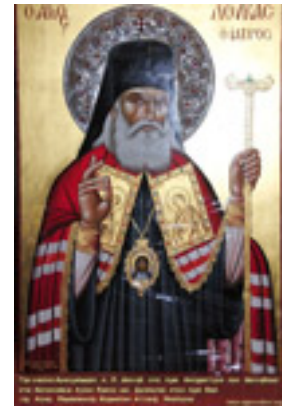
Άγιος Λουκάς Αρχιεπίσκοπος Συμφερουπόλεως και Κριμαίας