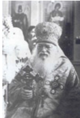
Άγιος Λουκάς Αρχιεπίσκοπος Συμφερουπόλεως και Κριμαίας