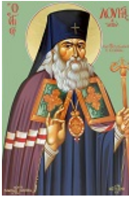
Άγιος Λουκάς Αρχιεπίσκοπος Συμφερουπόλεως και Κριμαίας - Μιχαήλ Χατζημιχαήλ© www.michaelhadjimichael.com