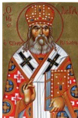
Άγιος Λουκάς Αρχιεπίσκοπος Συμφερουπόλεως και Κριμαίας - Μιχαήλ Χατζημιχαήλ