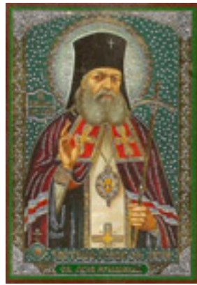
Άγιος Λουκάς Αρχιεπίσκοπος Συμφερουπόλεως και Κριμαίας