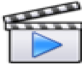
Το Θαύμα στην<br />Ρωσία με το παιδί