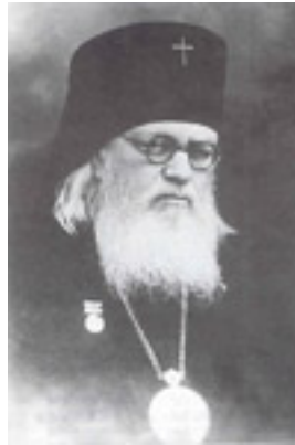
Άγιος Λουκάς Αρχιεπίσκοπος Συμφερουπόλεως και Κριμαίας