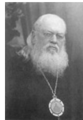
Άγιος Λουκάς Αρχιεπίσκοπος Συμφερουπόλεως και Κριμαίας