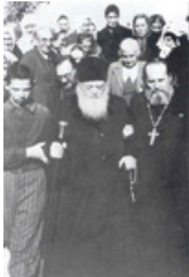
Άγιος Λουκάς Αρχιεπίσκοπος Συμφερουπόλεως και Κριμαίας