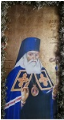
Άγιος Λουκάς Αρχιεπίσκοπος Συμφερουπόλεως και Κριμαίας - Άγιος Νικόλαος, Νάουσα, Πάρος