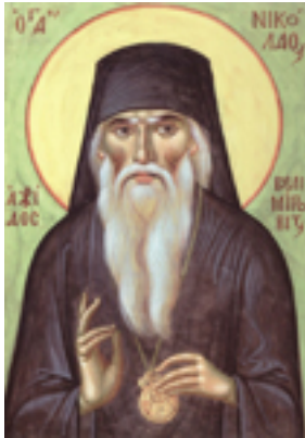
Άγιος Νικόλαος Επίσκοπος Αχρίδος και Ζίτσης