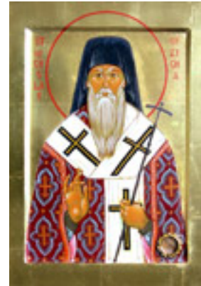
Άγιος Νικόλαος Επίσκοπος Αχρίδος και Ζίτσης