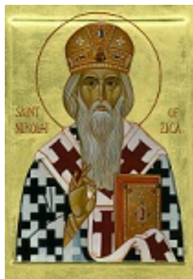
Άγιος Νικόλαος Επίσκοπος Αχρίδος και Ζίτσης