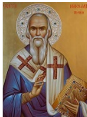
Άγιος Νικόλαος Επίσκοπος Αχρίδος και Ζίτσης