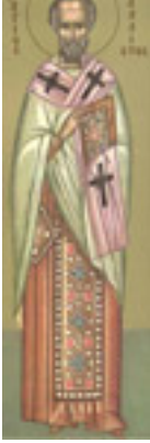
Όσιος Κάλλιστος Πατριάρχης Κωνσταντινούπολης