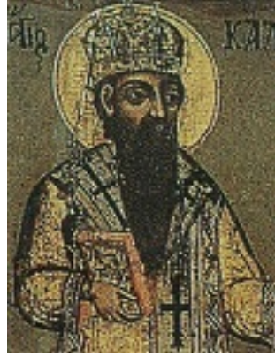
Όσιος Κάλλιστος Πατριάρχης Κωνσταντινούπολης