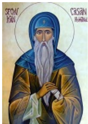
Όσιος Κασσιανός ο Ρωμαίος