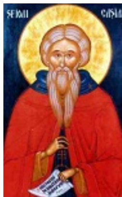
Όσιος Κασσιανός ο Ρωμαίος