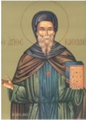
Όσιος Κασσιανός ο Ρωμαίος