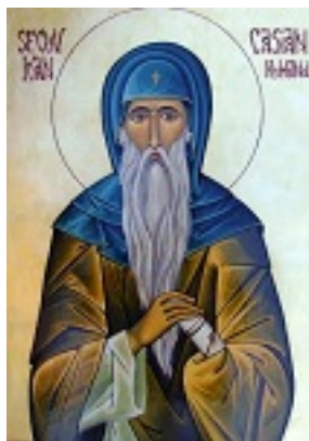
Όσιος Κασσιανός ο Ρωμαίος