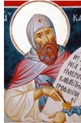
Όσιος Κασσιανός ο Ρωμαίος