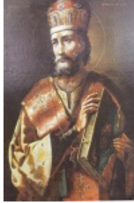
Εικόνα του Αγίου Αρσενίου Αρχιεπισκόπου Ελασσώνας – Καθεδρικός Ναός Σουσδαλίου – Ρωσίας