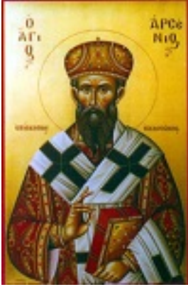
Άγιος Αρσένιος Αρχιεπίσκοπος Ελασσώνας