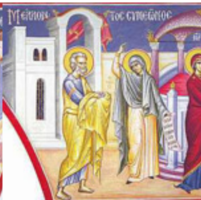
Μέλλοντος Συμεῶνος, τοῦ παρόντος αἰῶνος....