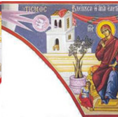
Βλέπουσα ἡ Ἁγία, ἐαυτὴν ἐν ἀγνείᾳ....