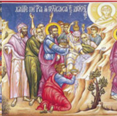
Χαῖρε, πέτρα ἠποτίσασα τοὺς διψῶντας τὴν ζωὴν....