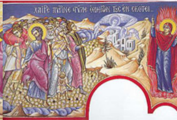
Χαῖρε, πύρινη στυλε ὁδηγῶν τοὺς ἐν σκότει....