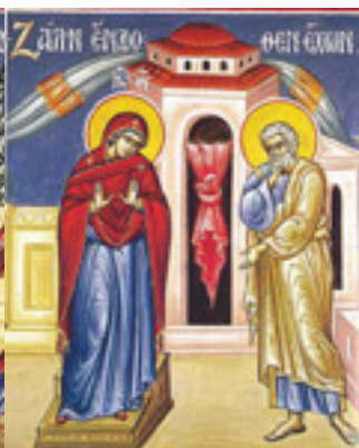
Ζάλην ἐνδοθεν ἔχων....