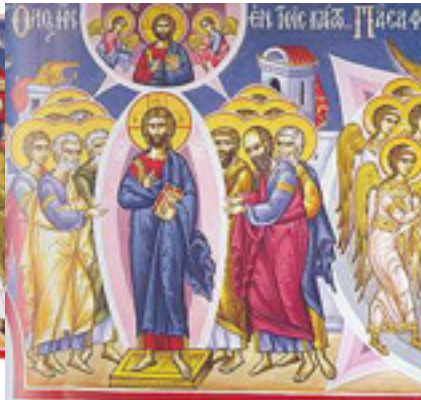
Ὅλος ἦν ἐν τοῖς κάτω... / Πᾶσα φύσις Ἀγγέλων, κατεπλάγη τὸ μέγα....