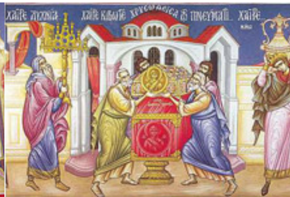
Χαῖρε, κιβωτὲ χρυσοθεῖσα τῷ Πνεύματι....