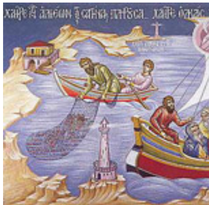
Χαῖρε, τῶν ἀλιέων τὰς σαγήνας πληροῦσα.... / Χαῖρε, ὀλκὰς τῶν θελώντων σωθῆναι....