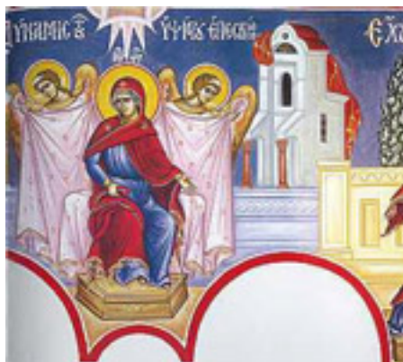
Δύναμις τοῦ Ὑψίστου, ἐπεσκίασε τότε.... / Ἐχουσα θεοδόχον, ἡ Παρθένος τὴν μήτραν....