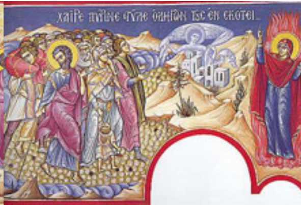
Χαῖρε, πύρινη στυλὲ ὁδηγῶν τοὺς ἐν σκότει....