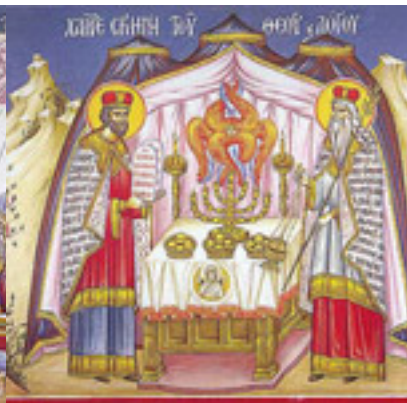
Χαῖρε, σκηνὴ τοῦ Θεοῦ καὶ Λόγου....