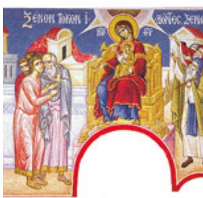
Ξένον τόκον ἰδόντες, ξενωθῶμεν τοῦ κόσμου....