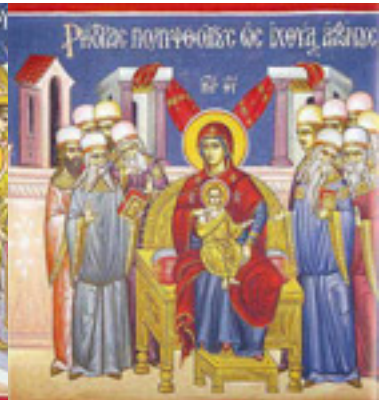
Ρήτορας πολυφθόγγους, ὡς ἰχθύας ἀφώνους....