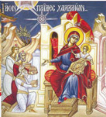
Ἴδον παῖδες Χαλδαίων....