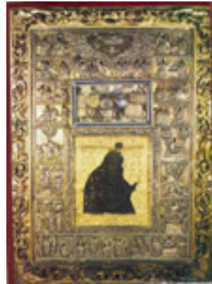
Ακάθιστος Ύμνος - Η εικόνα βρίσκεται στην Ι.Μ. Διονυσίου Αγίου Όρους