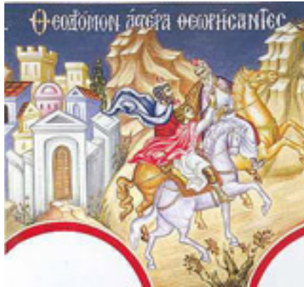
Θεοδόμον ἄστερα, θεωρήσαντες Μάγοι....