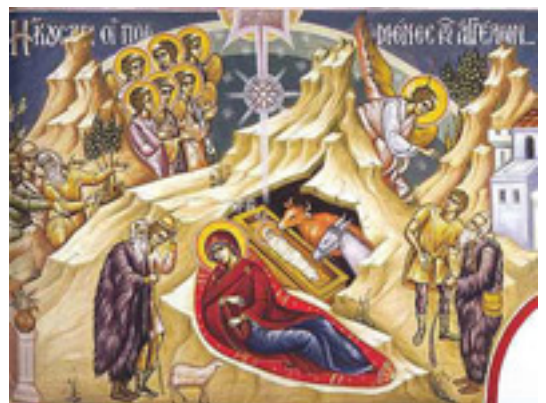
Ἦκουσαν οἱ ποιμένες, τῶν Ἀγγέλων ὕμνούντων....