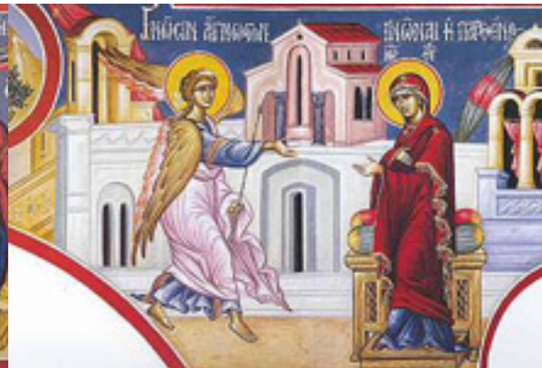
Γνώσιν ἄγνωστον γνῶναι, ἡ Παρθένος ζητοῦσα....