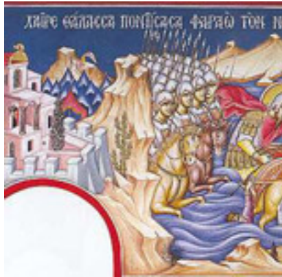
Χαῖρε, θάλασσα πονήσασα Φαραῶ τὸν νοητόν....