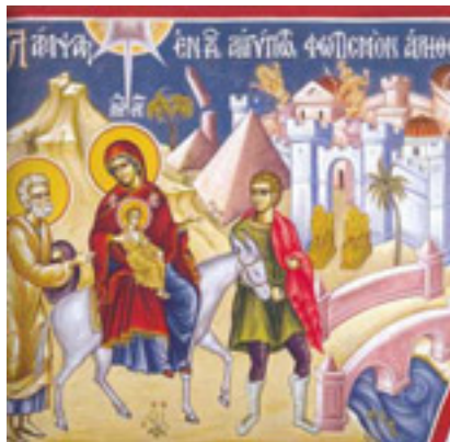
Λάμπας ἐν τῇ Αἰγύπτῳ, φωτισμὸν ἀληθείας ἐδίωξας....