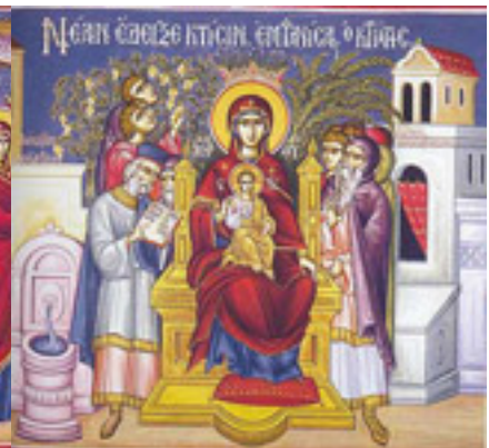
Νέαν ἔδειξε κτίσιν, ἐμφανίσας ὁ Κτίστης....