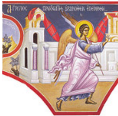
Ἄγγελος πρωτοστάτης, οὐρανόθεν ἐπέμφθη....