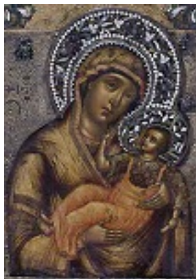
Σύναξη Υπεραγίας Θεοτόκου εν Μούρωμ Ρωσίας