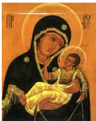
Σύναξη Υπεραγίας Θεοτόκου εν Μούρωμ Ρωσίας