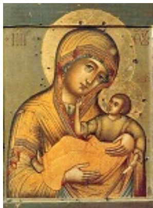
Σύναξη Υπεραγίας Θεοτόκου εν Μούρωμ Ρωσίας