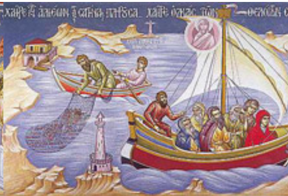
Χαῖρε, τῶν ἀλιέων τὰς σαγήνας πληροῦσα.... / Χαῖρε, ὀλκάς τῶν θειλόντων σωθῆναι....