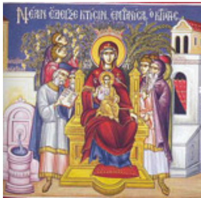
Νέαν ἔδειξε κτίσιν, ἐμφανίσας ὁ Κτίστης....