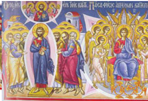
Ὅλως ἦν ἐν τοῖς κάτω.... / Πᾶσα φύσις Ἀγγέλων, κατεπλάγη τὸ μέγα....