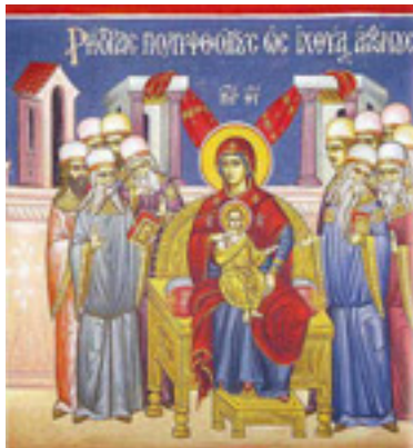
Ρήτορας πολυφθόγγους, ὡς ἰχθύας ἀφώνους....