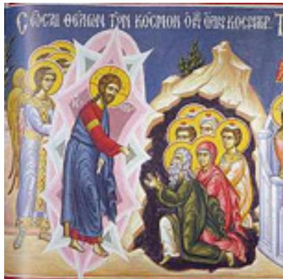
Σῶσαι θέλων τὸν κόσμον, ὁ τῶν ὄλων κοσμητῶν.... / Τεῖχος εἶ τῶν παρθένων, Θεοτόκε Παρθένε....