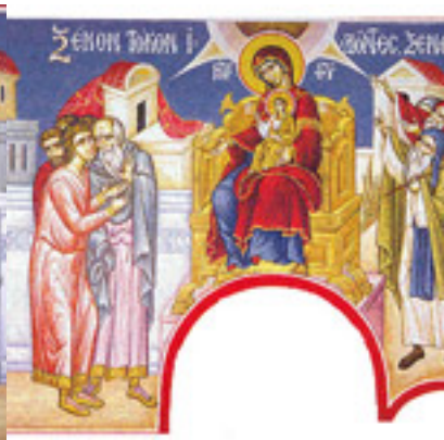
Ξένον τόκον ἰδόντες, ξενωθῶμεν τοῦ κόσμου....