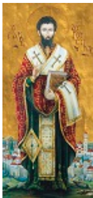
Άγιος Αυγουστίνος Επίσκοπος Ιππώνος