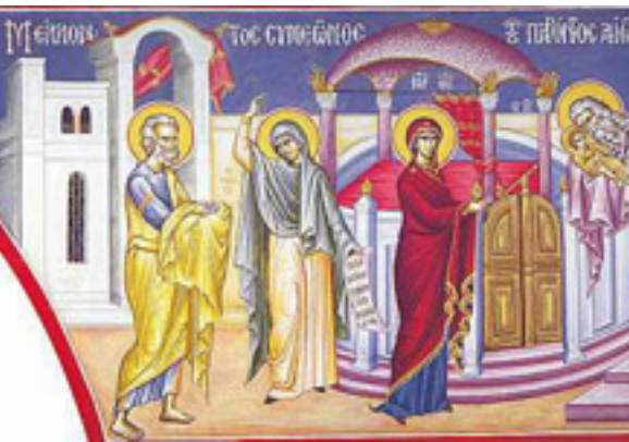
Μέλλοντος Συμεῶνος, τοῦ παρόντος αἰῶνος....