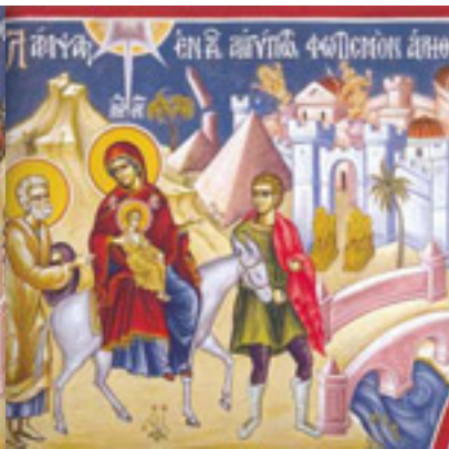
Λάμπας ἐν τῇ Αἰγύπτῳ, φωτισμὸν ἀληθείας ἐδίωξας....