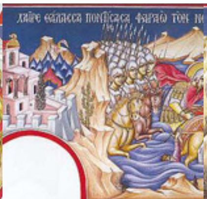
Χαῖρε, θάλασσα ποντίσασα Φαραῶ τὸν νοητόν....