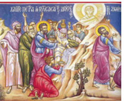
Χαῖρε, πέτρα ἢ ποτίσασα τοὺς διψῶντας τὴν ζωὴν....