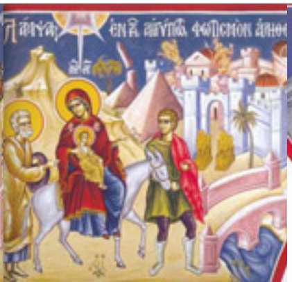
Λάμπας ἐν τῇ Αἰγύπτῳ, φωτισμὸν ἀληθείας ἐδίωξας....