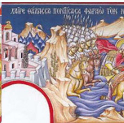
Χαῖρε, θάλασσα ποντίσασα Φαραῶ τὸν νοητόν....