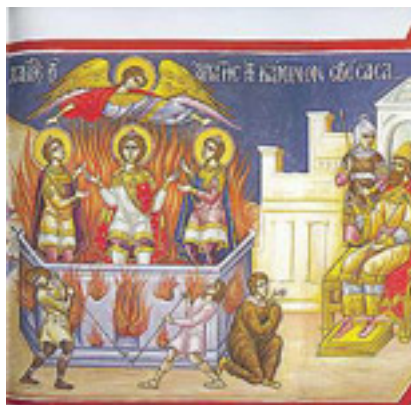
Χαῖρε, τῆς ἀπάτης τὴν κάμινον σβέσασα....