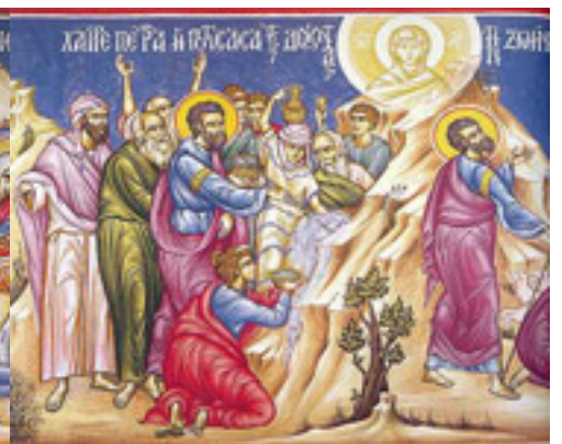
Χαῖρε, πέτρα ἢ ποτίσασα τοὺς διψῶντας τὴν ζωὴν....