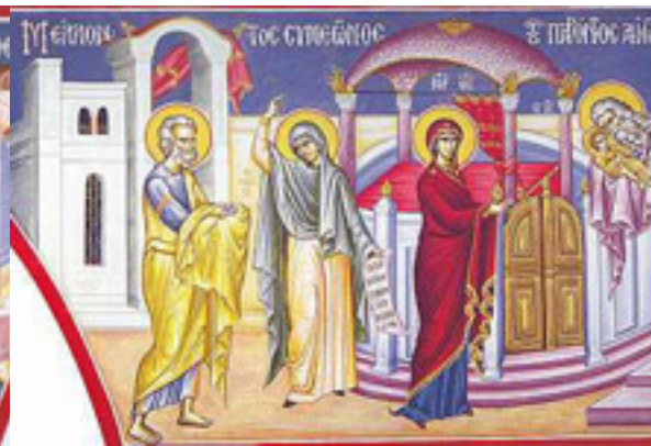
Μέλλοντος Συμεῶνος, τοῦ παρόντος αἰῶνος....