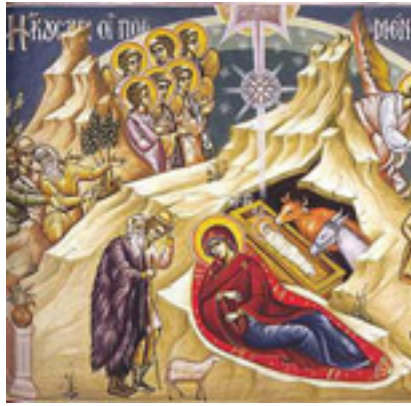
Ἦκουσαν οἱ ποιμένες, τῶν Ἀγγέλων ὑμνούντων....