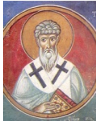
Άγιος Τριφύλλιος Επίσκοπος Λήδρας - Τοιχογραφία που βρίσκεται στο ναό της Παναγίας του Άρακα. 1192 μ.Χ.