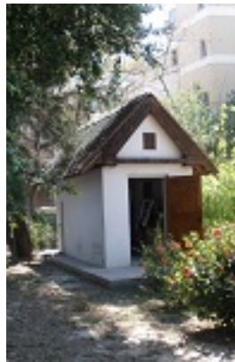
Ο μοναδικός ναός που αφιερωμένος στον Άγιο Τριφύλλιο πρώτο Επίσκοπο της Λευκωσίας στην αυλή του Δημοτικού Σχολείου Ελένειον