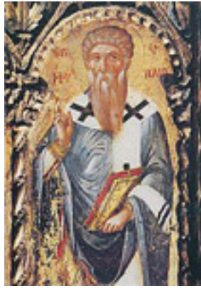
Άγιος Τριφύλλιος Επίσκοπος Λήδρας