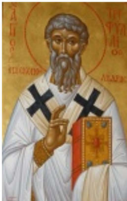
Άγιος Τριφύλλιος Επίσκοπος Λήδρας