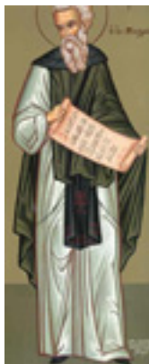
Όσιος Γεώργιος ο εν Μαλεώ