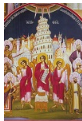
Βαβέλ - Ι.Μ. Παρακλήτου 2000 μ.Χ.