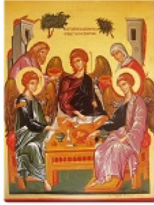
Η φιλοξενία του Αβραάμ - Γεωργία Δαμικούκα© ( http://www.tempera.gr )