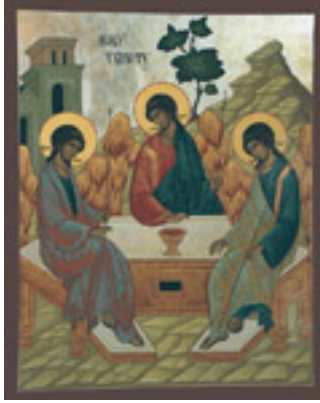
Η φιλοξενία του Αβραάμ - Προτύπωση του τριαδικού Θεού στην Παλαιά Διαθήκη