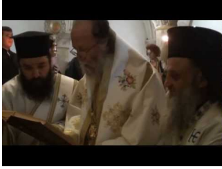
Δευτέρα Αγίου Πνεύματος στην Αγία Σιών