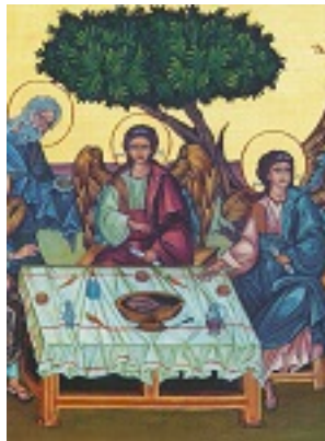
Η φιλοξενία του Αβραάμ - Δια χειρός: Μαριγούλας Νώε