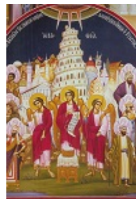
Βαβέλ - Ι.Μ. Παρακλήτου 2000 μ.Χ.