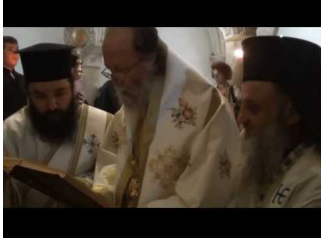
Δευτέρα Αγίου Πνεύματος στην Αγία Σιών