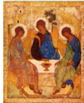
Η φιλοξενία του Αβραάμ - Andrei Rublev