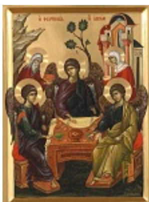
Η φιλοξενία του Αβραάμ