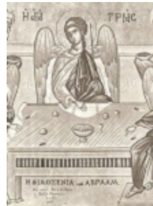
Η φιλοξενία του Αβραάμ - Φώτης Κόντογλου