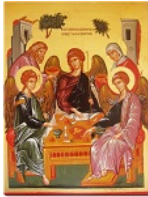
Η φιλοξενία του Αβραάμ - Γεωργία Δαμικούκα© ( http://www.tempera.gr )