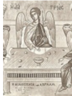
Η φιλοξενία του Αβραάμ - Φώτης Κόντογλου