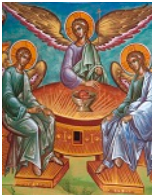
Η φιλοξενία του Αβραάμ - π. Σταμάτης Σκλήρης© (stamatis- skliris.gr)