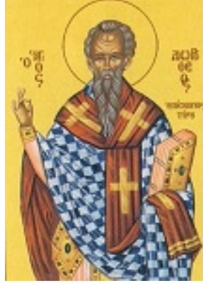
Άγιος Δωρόθεος Ιερομάρτυρας επίσκοπος Τύρου