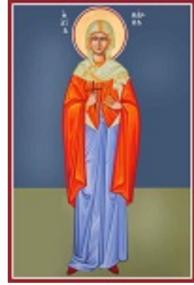
Αγία Μάρθα αδελφή του Λαζάρου -

Καζακίδου Μαρία© (byzantineartkazakidou. blogspot.com)