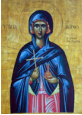
Αγία Μάρθα αδελφή του Λαζάρου