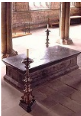
Ο τάφος του Οσίου Βεδέα του Ομολογητή