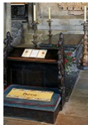
Ο τάφος του Οσίου Βεδέα του Ομολογητή