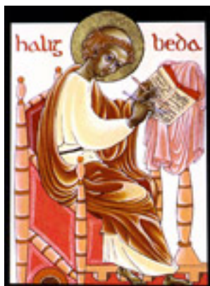
Όσιος Βεδέας ο Ομολογητής