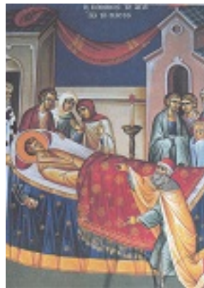
Η κοίμηση του Οσίου Ιωάννη του Ρώσου