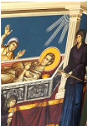
Η κοίμηση του Οσίου Ιωάννη του Ρώσου