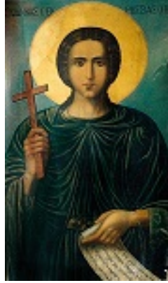
Όσιος Ιωάννης ο Ρώσος