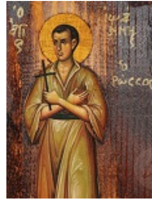
Όσιος Ιωάννης ο Ρώσος