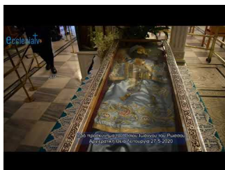
Οσίος Ιωάννου του Ρώσσου - Αρχιερατική Θ. Λειτουργία 27-5- 2020