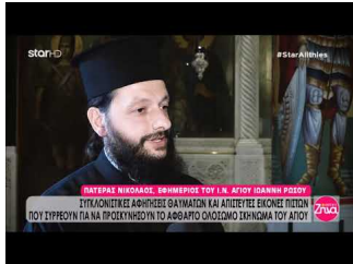
Τα θαυματα του Αγίου Ιωάννη Ρωσσου - συγκλονιστικές μαρτυρίες