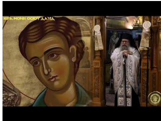
Ο Άγιος Ιωάννης ο Ρώσος με τον Άγιο Ιάκωβο Τσαλίκη (Λόγος Γέροντα Γαβριήλ)