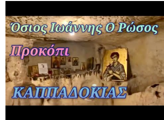
Όσιος Ιωάννης ο Ρώσος - Προκόπι Καππαδοκίας