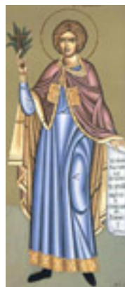
Όσιος Ιωάννης ο Ρώσος