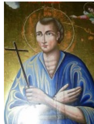
Όσιος Ιωάννης ο Ρώσος