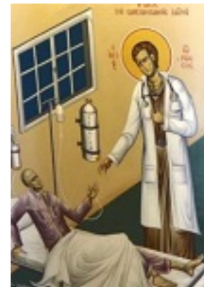
Όσιος Ιωάννης ο Ρώσος - Ηΐασις του καρκινοπαθούς Ιατρού