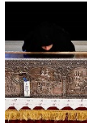
Η Λάρνακα του Οσίου Ιωάννη του Ρώσου