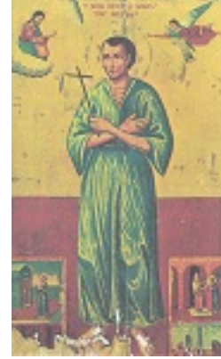
Όσιος Ιωάννης ο Ρώσος