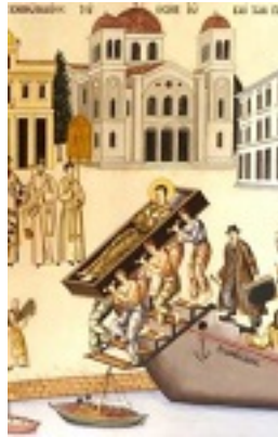
Όσιος Ιωάννης ο Ρώσος - Η Υποδοχή του Ιερού Σκηνώματος του Οσίου Ιωάννη και των Προσφύγων στη Χαλκίδα