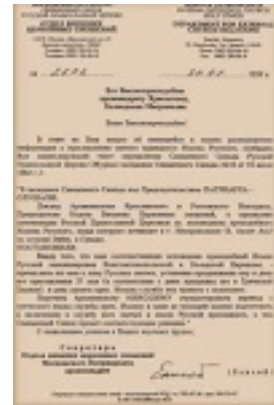
Το πρωτότυπο έγγραφο του Πατριαρχείου Μόσχας σχετικά με την αγιοκατάταξη του Οσίου Ιωάννου του Ρώσου