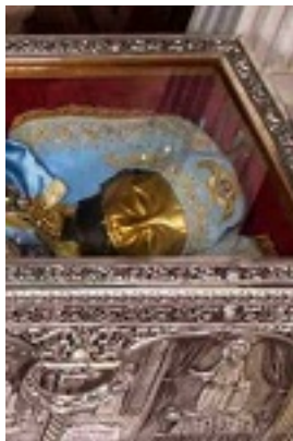
Η Λάρνακα του Οσίου Ιωάννη του Ρώσου