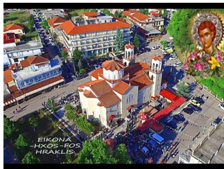
Άγιος Ιωάννης Ρώσος Εύβοια (Agiou Ioannis Rosos Prokori Evia) & Drone 2016