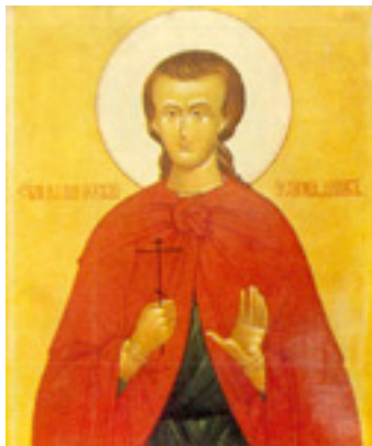
Όσιος Ιωάννης ο Ρώσος