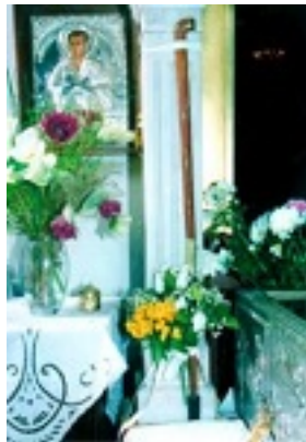
Το μπαστούνι της Μαρίας Σιάκα