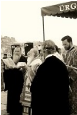
Ο Οικουμενικός Πατριάρχης Βαρθολομαίος τελεί την πανήγυρη του Οσίου Ιωάννου του Ρώσου στο Προκόπιο Καππαδοκίας το 2001 μ.Χ.