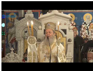
Ιερό προσκύνημα του Οσίου Ιωάννου του Ρώσσου - Αρχιερατικός Εσπερινός 26-5-2020