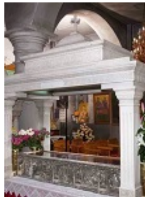
Η Λάρνακα του Οσίου Ιωάννη του Ρώσου