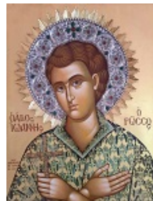
Όσιος Ιωάννης ο Ρώσος