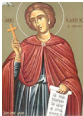
Όσιος Ιωάννης ο Ρώσος