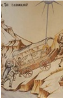
Όσιος Ιωάννης ο Ρώσος - Η Μαρτυρική Έξοδο του Ελληνισμού της Καππαδοκίας