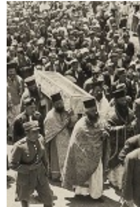
Νέο Προκόπιο Ευβοίας, Λιτανεία του Οσίου Ιωάννου του Ρώσου - 27/05/1940 μ.Χ.