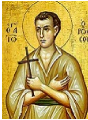
Όσιος Ιωάννης ο Ρώσος