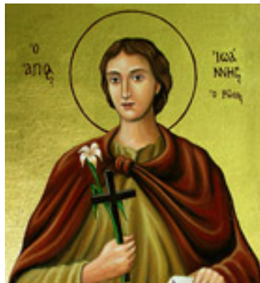
Όσιος Ιωάννης ο Ρώσος