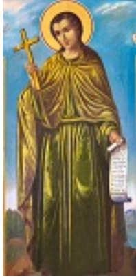
Όσιος Ιωάννης ο Ρώσος