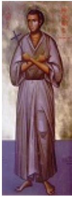
Όσιος Ιωάννης ο Ρώσος