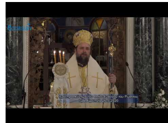
Ιερό προσκύνημα του Οσίου Ιωάννου του Ρώσσου - Ιερά Αγρυπνια 26-5-2020