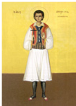
Άγιος Νεομάρτυρας Μήτρος (ή Δημήτριος)