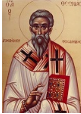
Όσιος Θεωνάς Αρχιεπίσκοπος Θεσσαλονίκης