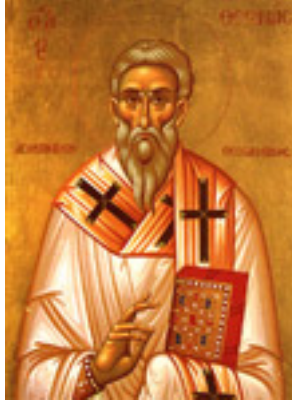
Όσιος Θεωνάς Αρχιεπίσκοπος Θεσσαλονίκης