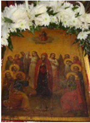
Η Ανάληψη του Κυρίου - Ομώνυμον Ιβηρικόν Κελλίον στις Καρυές