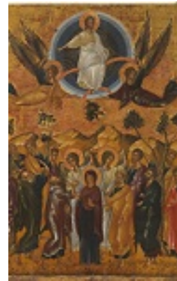
Η Ανάληψη του Κυρίου - δεύτερο μισό 15ου αιώνα μ.Χ., άγνωστος ζωγράφος του Χάνδακα