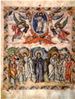
Η Ανάληψη του Κυρίου