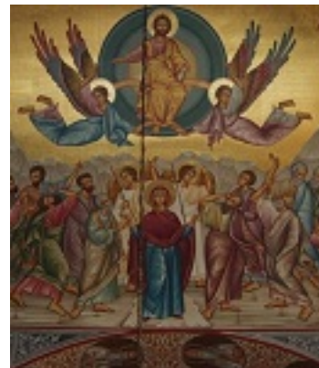
Η Ανάληψη του Κυρίου