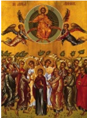
Η Ανάληψη του Κυρίου - Καρυές, Άγιον Όρος