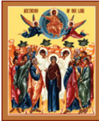
Η Ανάληψη του Κυρίου