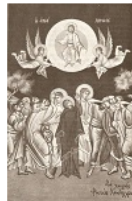
Η Ανάληψη του Κυρίου - Φώτης Κόντογλου