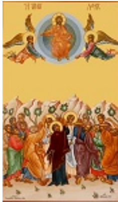
Η Ανάληψη του Κυρίου - Μιχαήλ Χατζημιχαήλ© www.michaelhadjimichael.com