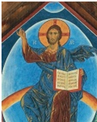
Η Ανάληψη του Κυρίου - Ι. Ν. Αγίου Τυχικού Κύπρος