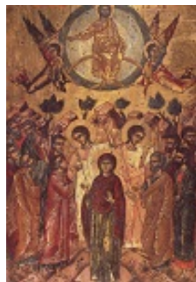
Η Ανάληψη του Κυρίου