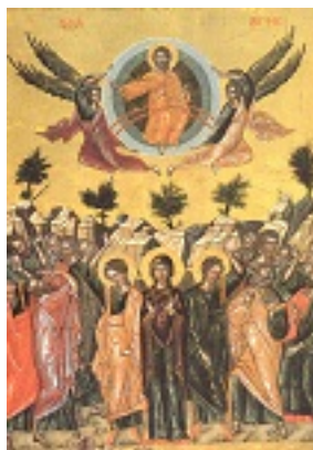
Η Ανάληψη του Κυρίου