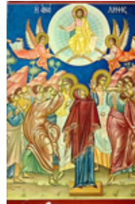
Η Ανάληψη του Κυρίου