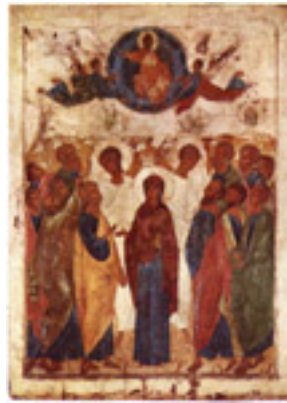
Αντρέι Ρουμπλιόβ - Η Ανάληψη του Κυρίου, 1410 μ.Χ.