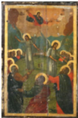
Η Ανάληψη του Κυρίου - Ι.Ν. Ζωοδόχου Πηγής, Λαρίσης ( http://www.panagialarisis.gr )