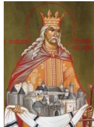
Άγιος Στέφανος ο μέγας, βοεβόδας της Μολδαβίας