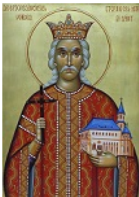
Άγιος Στέφανος ο μέγας, βοεβόδας της Μολδαβίας