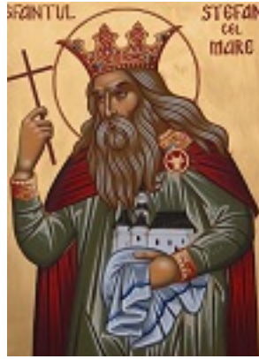
Άγιος Στέφανος ο μέγας, βοεβόδας της Μολδαβίας