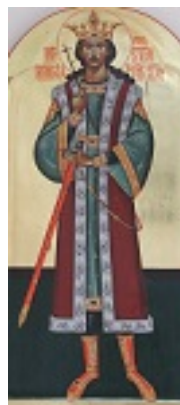
Άγιος Στέφανος ο μέγας, βοεβόδας της Μολδαβίας