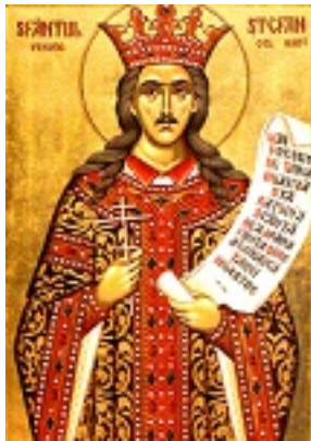
Άγιος Στέφανος ο μέγας, βοεβόδας της Μολδαβίας