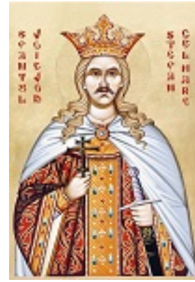
Άγιος Στέφανος ο μέγας, βοεβόδας της Μολδαβίας