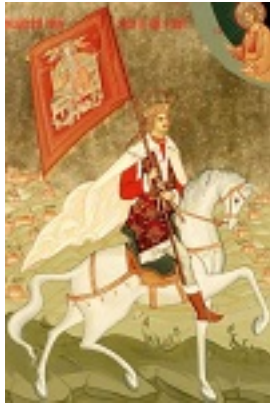
Άγιος Στέφανος ο μέγας, βοεβόδας της Μολδαβίας