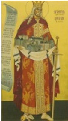
Άγιος Στέφανος ο μέγας, βοεβόδας της Μολδαβίας