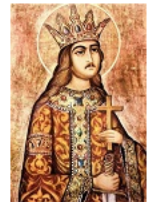
Άγιος Στέφανος ο μέγας, βοεβόδας της Μολδαβίας