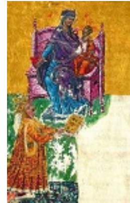
Άγιος Στέφανος ο μέγας, βοεβόδας της Μολδαβίας