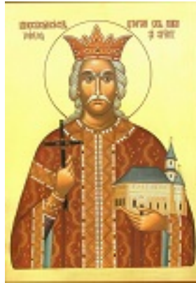
Άγιος Στέφανος ο μέγας, βοεβόδας της Μολδαβίας