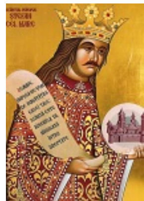
Άγιος Στέφανος ο μέγας, βοεβόδας της Μολδαβίας