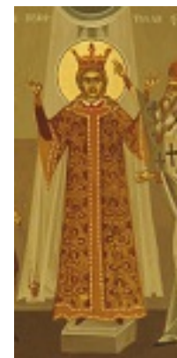
Άγιος Στέφανος ο μέγας, βοεβόδας της Μολδαβίας