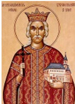
Άγιος Στέφανος ο μέγας, βοεβόδας της Μολδαβίας