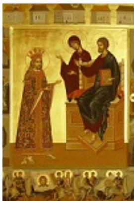
Άγιος Στέφανος ο μέγας, βοεβόδας της Μολδαβίας