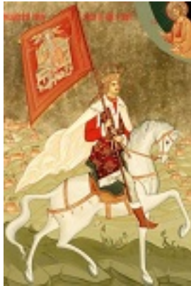
Άγιος Στέφανος ο μέγας, βοεβόδας της Μολδαβίας