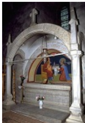
Ο τάφος του Αγίου Στεφάνου της Μολδαβίας στην Μονή Πούτνα