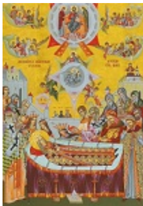
Η κοίμηση του Αγίου Στεφάνου της Μολδαβίας