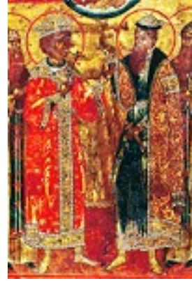
Όσιος Κασσιανός ο Έλληνας και Θαυματουργός