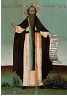
Όσιος Κασσιανός ο Έλληνας και Θαυματουργός