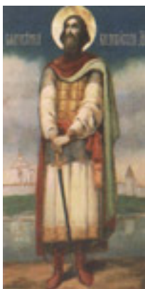
Άγιος Τιμόθεος του Πσκόφ