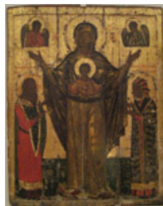
Άγιος Τιμόθεος του Πσκόφ