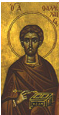
Άγιος Θαλλέλαιος ο Ανάργυρος