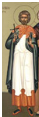
Άγιος Θαλλέλαιος ο Ανάργυρος