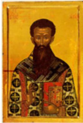
Άγιος Γρηγόριος ο Παλαμάς Αρχιεπίσκοπος Θεσσαλονίκης, ο Θαυματουργός - τέλη 16ου αι. μ.Χ. - Μονή Διονυσίου, Άγιον Όρος