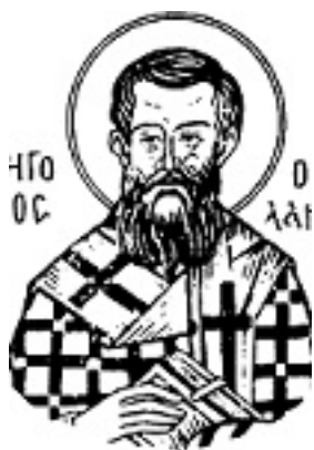
Άγιος Γρηγόριος ο Παλαμάς Αρχιεπίσκοπος Θεσσαλονίκης, ο Θαυματουργός