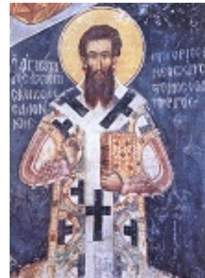
Άγιος Γρηγόριος ο Παλαμάς Αρχιεπίσκοπος Θεσσαλονίκης, ο Θαυματουργός