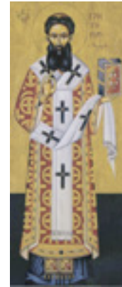
Άγιος Γρηγόριος ο Παλαμάς Αρχιεπίσκοπος Θεσσαλονίκης, ο Θαυματουργός