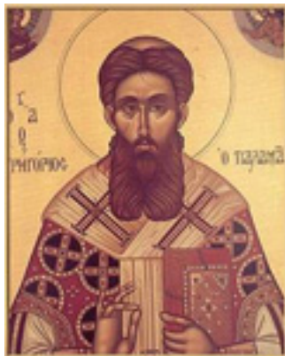
Άγιος Γρηγόριος ο Παλαμάς Αρχιεπίσκοπος Θεσσαλονίκης, ο Θαυματουργός