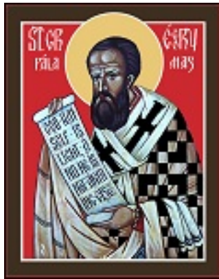
Άγιος Γρηγόριος ο Παλαμάς Αρχιεπίσκοπος Θεσσαλονίκης, ο Θαυματουργός