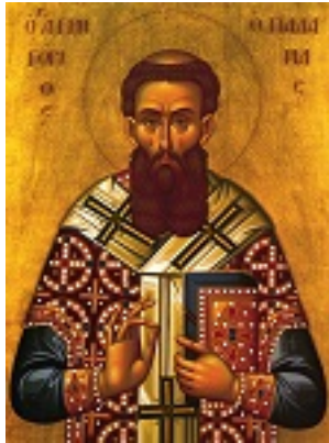
Άγιος Γρηγόριος ο Παλαμάς Αρχιεπίσκοπος Θεσσαλονίκης, ο Θαυματουργός