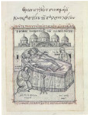
Θρηνητικό συναξάρι Κωνσταντίνου Παλαιολόγου - Φώτης Κόντογλου, 1949