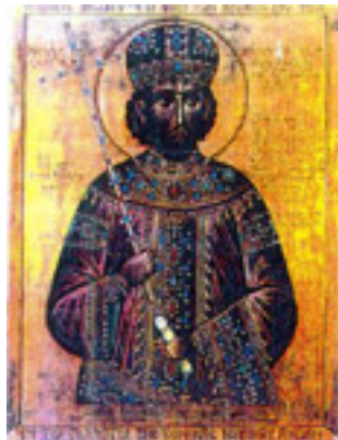
Κωνσταντίνος ΙΑ' Παλαιολόγος