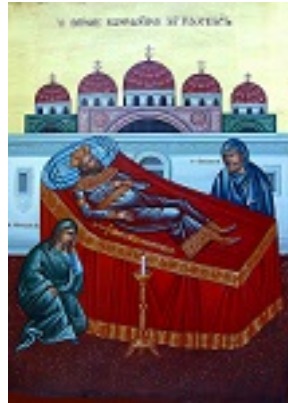
Θρήνος Κωνσταντίνου Παλαιολόγου - Π. Κούβαρη και Ι. Χ. Θωμάς© (icones.gr)