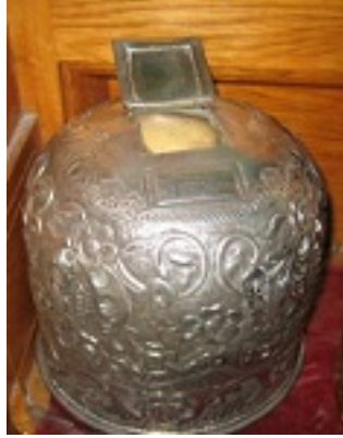
Η Κάρα Αγίας Υπομονής που βρίσκεται στη Μονή του Οσίου Παταπίου