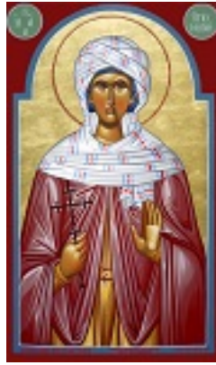
Αγία Υπομονή - Μιχαήλ Χατζημιχαήλ© www.michaelhadjimichael.com