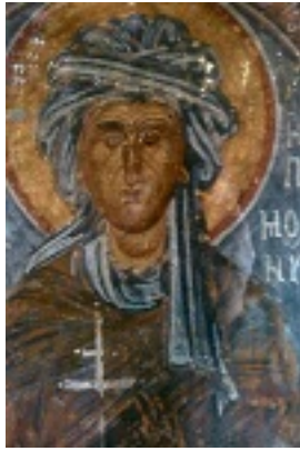
Βυζαντινή αγιογραφία της Αγίας Υπομονής στο σπήλαιο του Οσίου Παταπίου