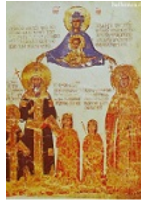
Πορτραίτο του Εμμανουήλ Β΄ του Παλαιολόγου με τη σύζυγό του Ελένη (Αγία Υπομονή) και δύο τους τέκνα