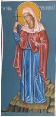
Αγία Υπομονή - Πηνελόπη Σχιζοδήμου© ( www.porpe.gr )