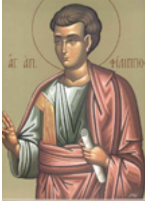
Άγιος Φίλιππος ο Απόστολος