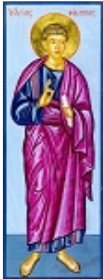
Άγιος Φίλιππος ο Απόστολος