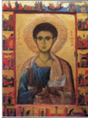
Άγιος Φίλιππος ο Απόστολος