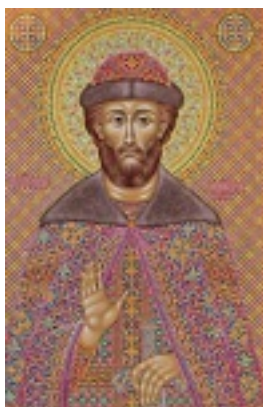
Άγιος Δημήτριος Ντονσκόι, ο μεγάλος Πρίγκιπας