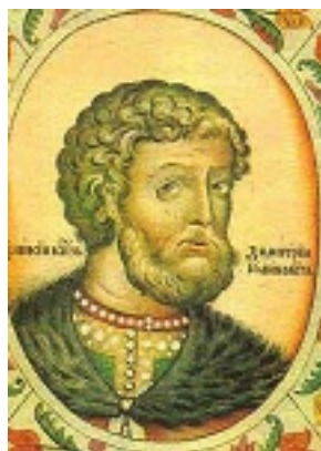
Άγιος Δημήτριος Ντονσκόι, ο μεγάλος Πρίγκιπας