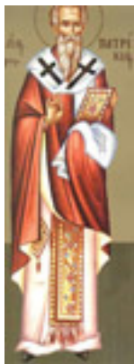
Άγιος Πατρίκιος επίσκοπος Προύσας