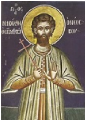
Άγιος Νικόλαος εκ Μετσόβου