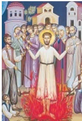
Άγιος Νικόλαος εκ Μετσόβου