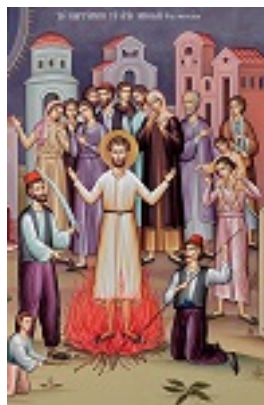
Άγιος Νικόλαος εκ Μετσόβου