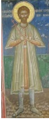
Άγιος Νικόλαος εκ Μετσόβου