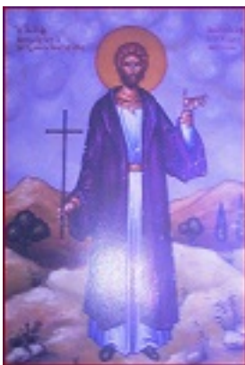
Άγιος Νικόλαος εκ Μετσόβου