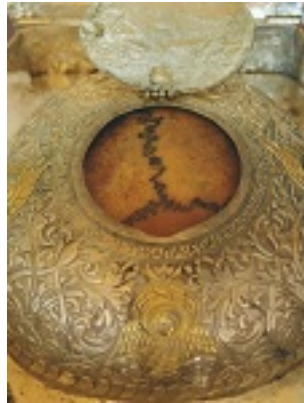
Η τιμια κάρα του Αγίου Νικολάου εκ Μετσόβου