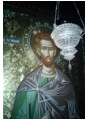
Άγιος Νικόλαος εκ Μετσόβου