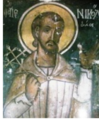
Άγιος Νικόλαος εκ Μετσόβου