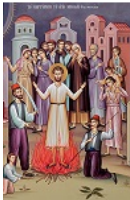
Άγιος Νικόλαος εκ Μετσόβου