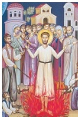
Άγιος Νικόλαος εκ Μετσόβου