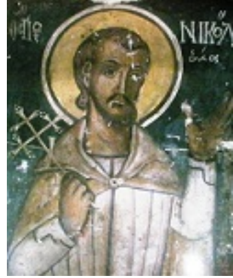
Άγιος Νικόλαος εκ Μετσόβου