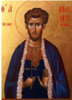
Άγιος Νικόλαος εκ Μετσόβου - Κωνσταντίνος Γιαννάκης© (www.orthodox-icon.gr)