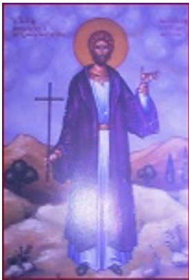
Άγιος Νικόλαος εκ Μετσόβου