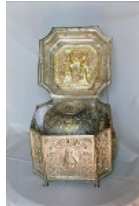
Η τιμια κάρα του Αγίου Νικολάου εκ Μετσόβου