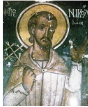
Άγιος Νικόλαος εκ Μετσόβου