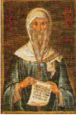
Όσιος Ανδρέας<br />ο Ερημίτης και<br />Θαυματουργός