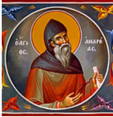
Όσιος Ανδρέας<br />ο Ερημίτης και<br />Θαυματουργός