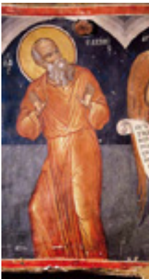
Όσιος Παχώμιος ο Μέγας