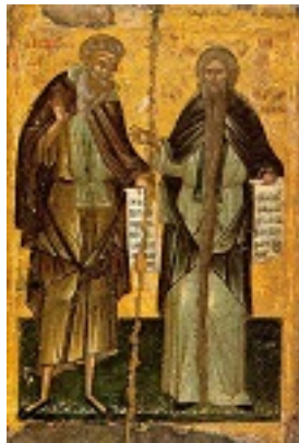
Οι άγιοι Δαβίδ και Παχώμιος - 16ος - 17ος αι μ.Χ. - Μονή Διονυσίου, Άγιον Όρος