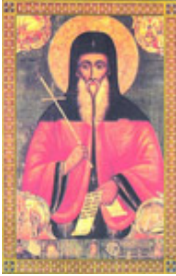
Όσιος Παχώμιος ο Μέγας