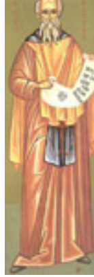
Όσιος Παχώμιος ο Μέγας