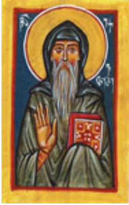
Όσιος Ευθύμιος ο Νέος κτήτορας της Μονής Ιβήρων Αγίου Όρους