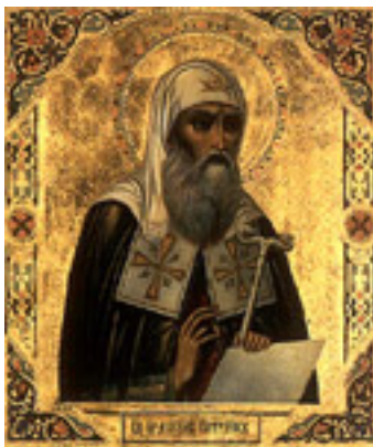
Άγιος Ερμογένης ο Ιερομάρτυρας Πατριάρχης Μόσχας