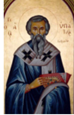
Άγιος Υπάτιος επίσκοπος Γαγγρών