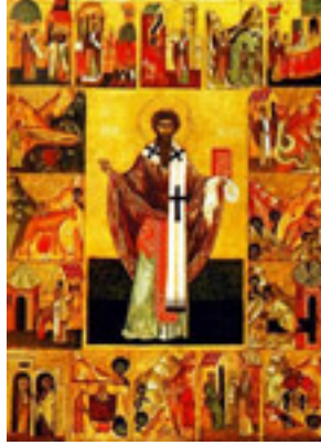
Άγιος Υπάτιος επίσκοπος Γαγγρών