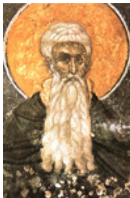
Όσιος Αρσένιος ο Μέγας