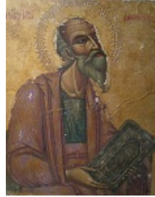
Άγιος Ιωάννης ο Θεολόγος - 18ος αιώνας μ.Χ, Μονή Παναγίας Τοχνίου, Μάνδρες Αμμοχώστου