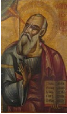
Άγιος Ιωάννης ο Θεολόγος - 18ος αιώνας μ.Χ