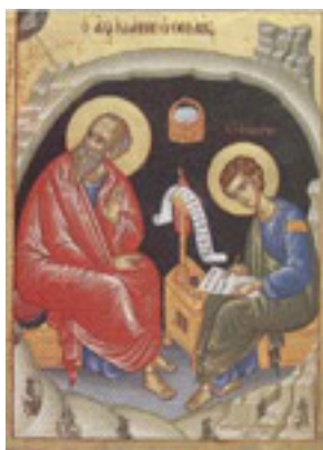
Άγιος Πρόχορος καὶ Ἅγιος Ἰωάννης ο Θεολόγος