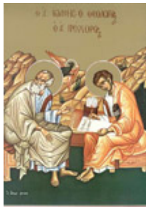
Άγιος Πρόχορος καὶ Ἅγιος Ἰωάννης ο Θεολόγος