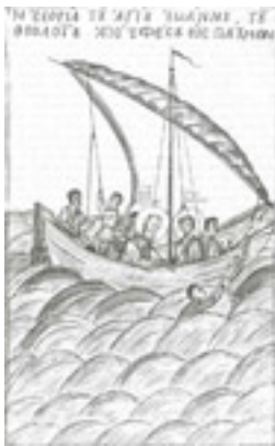
Ἡ ἐξορία τοῦ ἁγίου Ἰωάννου τοῦ Θεολόγου