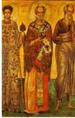
Άγιος Στέφανος, Νικόλαος, Ιωάννης ο Θεολόγος - 16ος και 18ος αι. μ.Χ. - Πρωτάτο, Άγιον Όρος