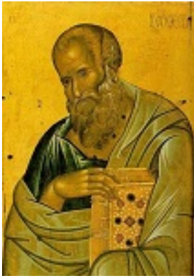
Άγιος Ιωάννης ο Θεολόγος - γ' τέταρτο 14ου αι. μ.Χ. - Μονή Βατοπαιδίου, Άγιον Όρος