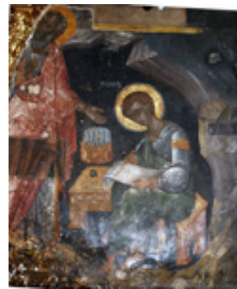
Άγιος Πρόχορος καὶ Ἅγιος Ἰωάννης ο Θεολόγος