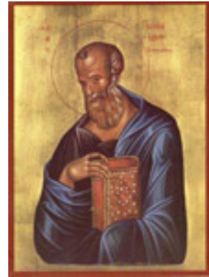
Άγιος Ιωάννης ο Θεολόγος