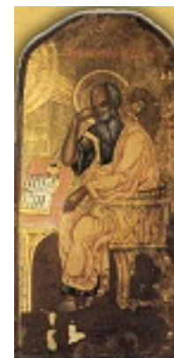
Άγιος Ιωάννης ο Θεολόγος - Φανάρι, Κωνσταντινούπολη