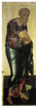
Άγιος Ιωάννης ο Θεολόγος - Αντρέι Ρουμπλιόβ, 1408 μ.Χ.