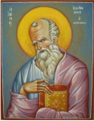
Άγιος Ιωάννης ο Θεολόγος - Αγγελική Τσέλιου © (diaxeirosaggelikistseliou. blogspot.com)