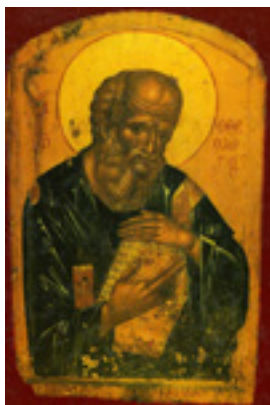
Άγιος Ιωάννης ο Θεολόγος