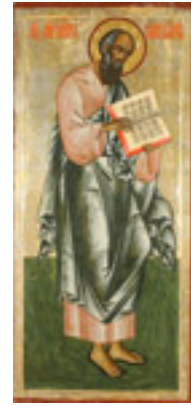
Άγιος Ιωάννης ο Θεολόγος