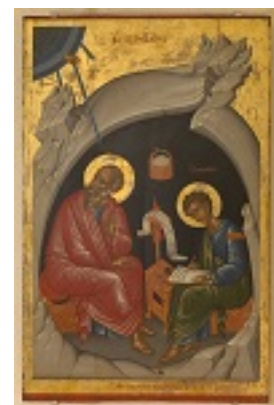
Άγιος Πρόχορος καὶ Ἅγιος Ἰωάννης ο Θεολόγος - Εμμανουήλ Λαμπάρδος, 1602 μ.Χ.