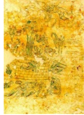
Σκηνή Αποκαλύψεως - Πρόκειται για την εικονογράφηση του ένατου κεφαλαίου της Αποκαλύψεως (χωρία 1-11), σύμφωνα με το οποίο «Και ο πέμπτος άγγελος εσάλπισεν. και είδον αστέρα εκ του ουρανού πεπτωκότα εις την γήν, και εδόθη αυτώ η κλείς του φρέατος της αβύσσου. και ήνοιξε το φρέαρ της αβύσσου, και ανέβη καπνός εκ του φρέατος ως καπνός καμίνου μεγάλης, και εσκοτίσθη ο ήλιος και ο αήρ εκ του καπνού του φρέατος. και εκ του καπνού εξήλθον ακρίδες εις την γήν,...» - 17ος αι. μ.Χ. - Μονή Διονυσίου, Άγιον Όρος