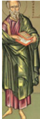
Άγιος Ιωάννης ο Θεολόγος