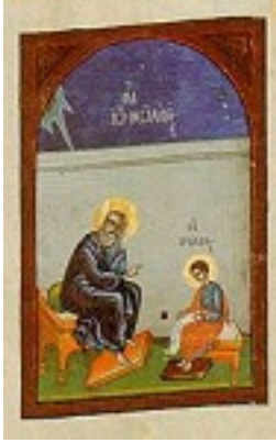
Άγιος Πρόχορος και Άγιος Ιωάννης ο Θεολόγος (Ευαγγέλιο) - 1629 μ.Χ. - Μονή Σίμωνος Πέτρας, Άγιον Όρος