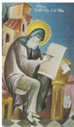
Ἅγιος Βλάσιος ο ἐξ Ἀμορίου