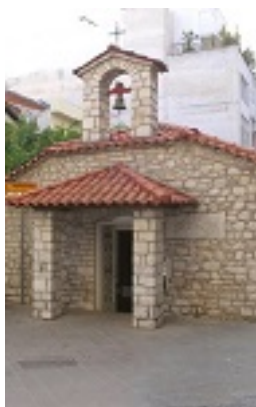
Παναγία η Κασσωπίτρα στην Άρτα