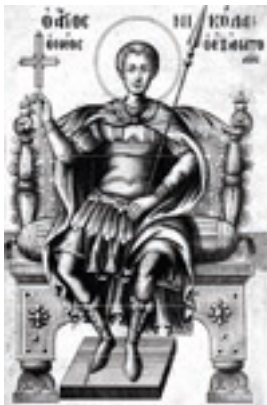
Άγιος Νικόλαος ο εν Βουνένις