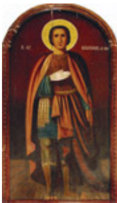
Άγιος Νικόλαος ο εν Βουνένοις (19ος αι. μ.Χ.)