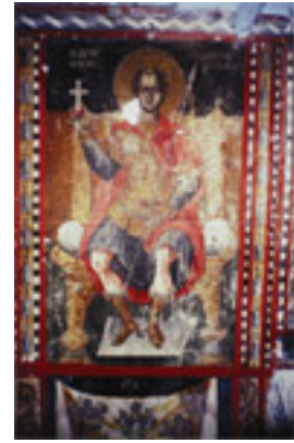
Άγιος Νικόλαος ο εν Βουνένις (Νωπογραφία 17ος αι. μ.Χ.)