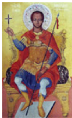
Άγιος Νικόλαος ο εν Βουνένοις (18ος αι. μ.Χ.)