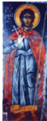
Άγιος Νικόλαος ο εν Βουνένοις (Νωπογραφία 12ος αι. μ.Χ.)