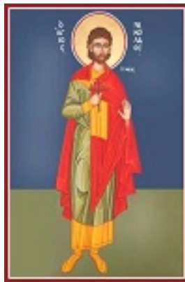
Άγιος Νικόλαος ο εν Βουνένις