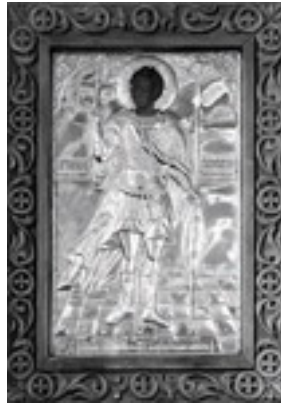
Αργυροσκέπαστη θαυματουργή Εικόνα του Αγίου Νικολάου του εν Βουνένις (16ος αι. μ.Χ.).