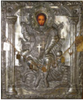
Άγιος Νικόλαος ο εν Βουνένις (15ος αι. μ.Χ.)