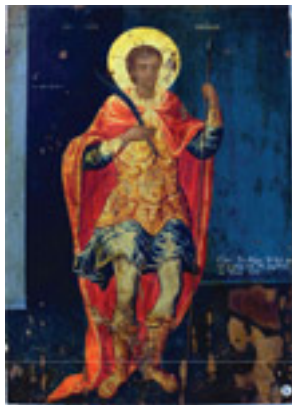
Άγιος Νικόλαος ο εν Βουνένοις (18ος αι. μ.Χ.)