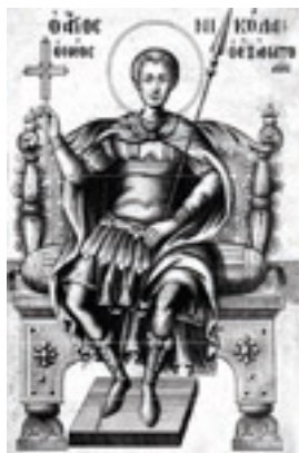
Άγιος Νικόλαος ο εν Βουνένις