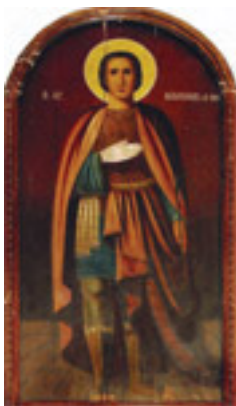
Άγιος Νικόλαος ο εν Βουνένοις (19ος αι. μ.Χ.)