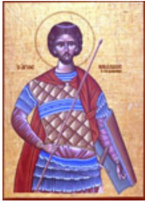
Άγιος Νικόλαος ο εν Βουνένοις