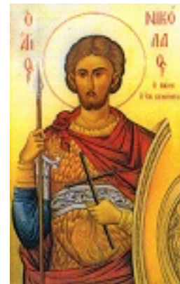
Άγιος Νικόλαος ο εν Βουνένις