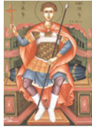
Άγιος Νικόλαος ο εν Βουνένοις