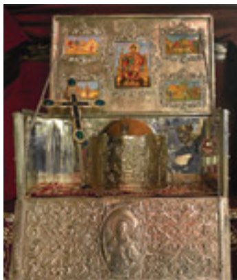
Η Πάντιμος Κάρα του Αγίου Νικολάου του εξ Ανατολής