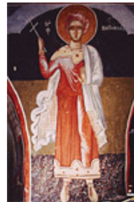
Άγιος Νικόλαος ο εν Βουνένοις (Νωπογραφία 16ος αι. μ.Χ.)