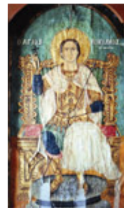
Άγιος Νικόλαος ο εν Βουνένοις