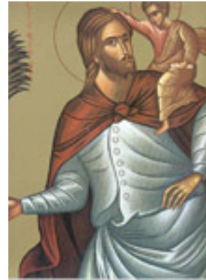
Άγιος Χριστόφορος ο Μεγαλομάρτυρας