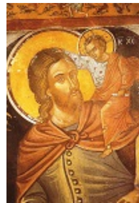
Άγιος Χριστόφορος ο Μεγαλομάρτυρας - Τοιχογραφία του καθολικού της Ιεράς Μονής Αγίου Νικολάου Αναπαυσά