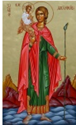
Άγιος Χριστόφορος ο Μεγαλομάρτυρας - Μιχαήλ Χατζημιχαήλ© www.michaelhadjimichael.com