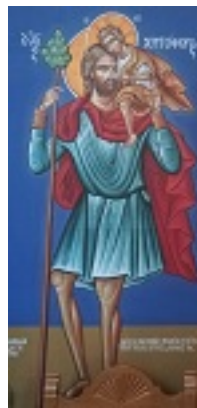
Άγιος Χριστόφορος ο Μεγαλομάρτυρας, Ιερός Ναός Παντανάσσης, Νάουσα Πάρου