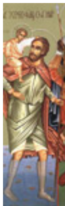
Άγιος Χριστόφορος ο Μεγαλομάρτυρας