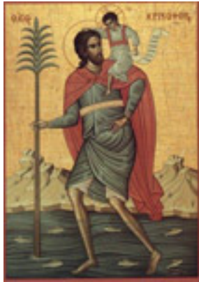
Άγιος Χριστόφορος ο Μεγαλομάρτυρας