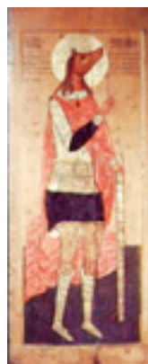
Άγιος Χριστόφορος ο Μεγαλομάρτυρας