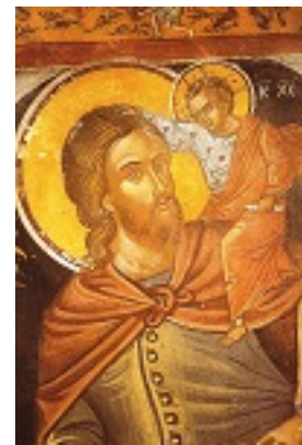
Άγιος Χριστόφορος ο Μεγαλομάρτυρας - Τοιχογραφία του καθολικού της Ιεράς Μονής Αγίου Νικολάου Αναπαυσά