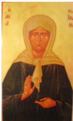
Οσία Ματρώνα εκ Ρωσίας