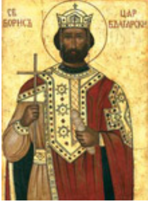
Άγιος Boris - Μιχαήλ ο πρίγκιπας, Ισαπόστολος και Φωτιστής